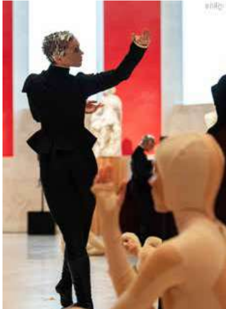
Compañía Nacional de Danza

1 Alcázar de Segovia. 20:00 h. Decimos verdades que parecen mentiras – Creadores. Compañía Nacional de Danza. CND. Aforo limitado. Sólo con invitación (disponibles en entradas. alcazardesegovia.com a partir del 10 de septiembre).