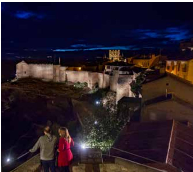
Puerta de San Andrés